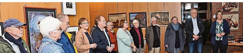
Viele Kunstfreunde aus der Region folgten der Einladung zur Eröffnung der Artotheken-Ausstellung im Rathaus.